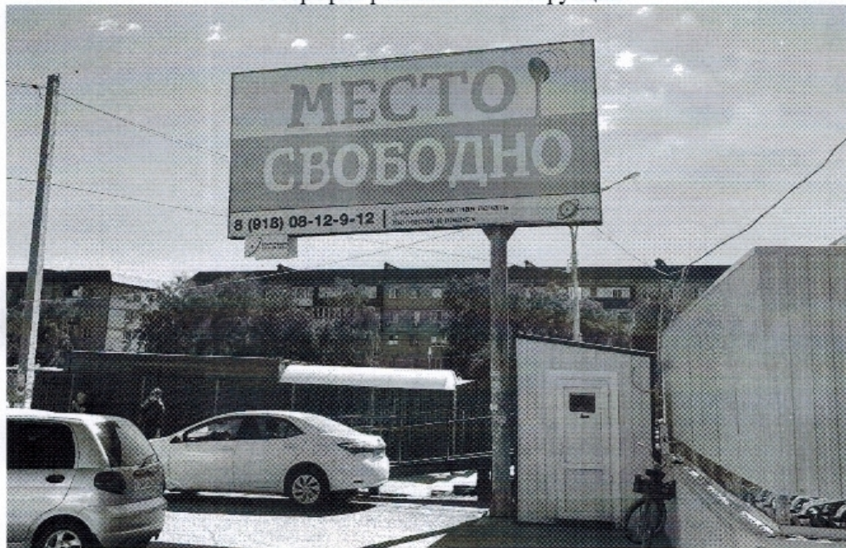
Фотография рекламной конструкции

Приложение к предписанию № 33 о демонтаже рекламной конструкции от « 26 » мая 2022 г.